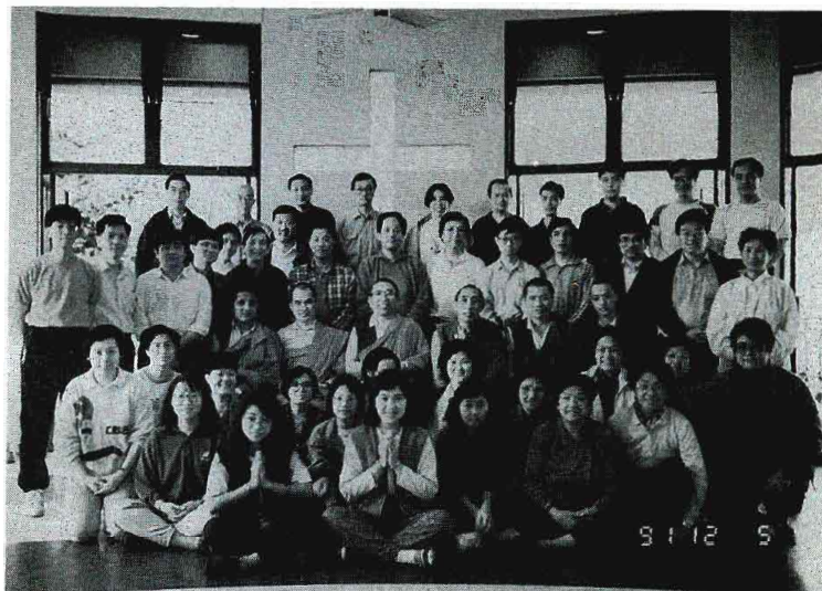
創古寧波車及參加大手印閉關之弟子合照於長州白普理營 (1991年12月)