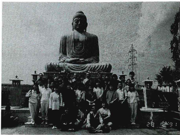
創古寧波車及朝聖團攝於菩提加耶