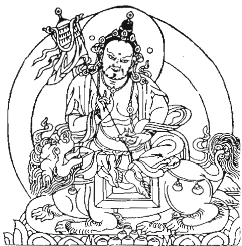
多聞天王 Nam Tho Se

黃色身，以獅子為座，自在菩薩坐姿，右手執勝利幡，左手抱吐寶鼠，頭帶寶冠，以璣珞、珠寶、天衣、彩絹等莊嚴其身。