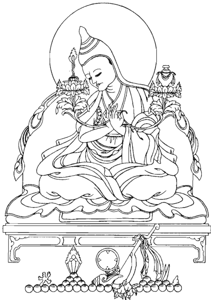
增剛康慈羅祖泰耶 Jamgon Kongtrul Lodro Thaye